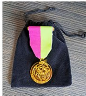
Médaille d'or Pour 15 ans