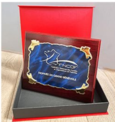
Plaque trophée Pour 30 ans