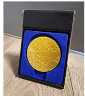
Grande médaille d'or Pour 20 ans