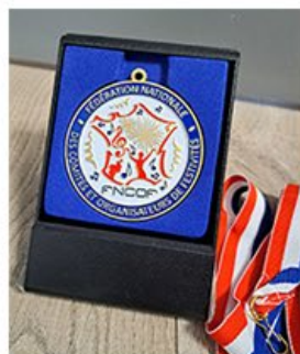
Médaille nationale collector